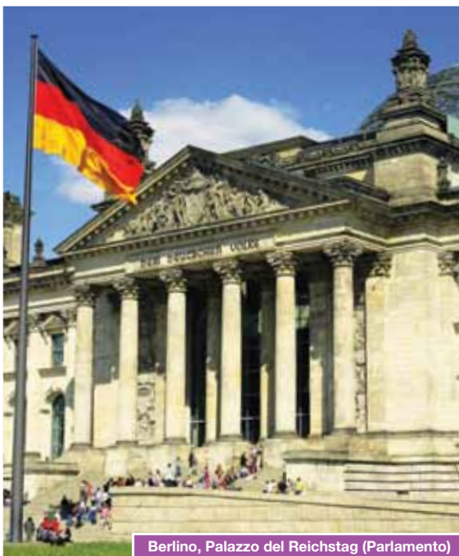
Berlino, Palazzo del Reichstag (Parlamento)

Seguendo le orme di Regina Jonas (1902-1944), la prima donna ebrea ordinata rabbina, andiamo alla scoperta di Berlino facendo un percorso nella storia del '900, fra divisioni, dittature, speranze e riconciliazioni. Dall'antico quartiere ebraico, centrato sulla sinagoga simbolo della vita distrutta e poi ricostruita, passiamo alla Berlino che, a partire dalla caduta del muro, si è trasformata in metropoli creativa richiamando artisti, designer e ingegneri da tutto il mondo: volano di tendenze artistiche, centro di innovazione tecnologica e della moda, è stata dichiarata dall'Unesco Città del Design. Berlino continua a "fare" la storia d'Europa, in bilico tra occidente e oriente, a metà strada tra Parigi e Mosca.