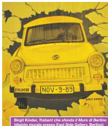
Birgit Kinder, Trabant che sfonda il Muro di Berlino (dipinto murale presso East Side Gallery, Berlino)

Per coloro che abitano lontano dal luogo previsto di partenza, Effatà Tour ha concordato con alberghi di Torino tariffe convenzionate riservate ai viaggiatori Effatà