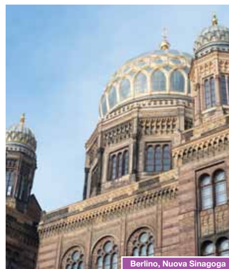
Berlino, Nuova Sinagoga

Colazione. Partenza per Norimberga, città di origine medioevale, che ospitava le celebrazioni del partito nazista. Pranzo libero lungo il percorso. Arrivo a Norimberga e visita dei luoghi delle grandi adunate hitleriane e delle sfilate nazional-socialiste: palazzo dei Congressi e la tribuna del campo Zeppelin, luogo della parate militari. Ingresso al Centro di documentazione