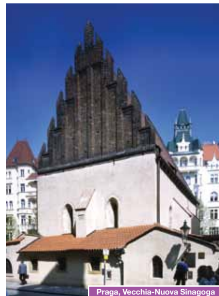
Praga, Vecchia-Nuova Sinagoga

Colazione. Partenza per Norimberga, città di origine medioevale, che ospitava le celebrazioni del partito nazista. Arrivo a Norimberga e visita dei luoghi delle grandi adunate hitleriane e delle sfilate nazional-socialiste: palazzo dei Congressi e tribuna del campo Zeppelin, luogo delle parate militari. Pranzo libero. Passeggiata panoramica nel centro storico: fortezza medievale ("Burg"); chiesa di san Sebald (uno dei centri della riforma protestante nel '500), chiesa medievale di nostra Signora ("Frauenkirche") costruita sulle rovine di una sinagoga distrutta durante un pogrom, fontana "Schöner