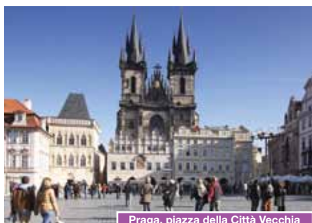
Praga, piazza della Città Vecchia